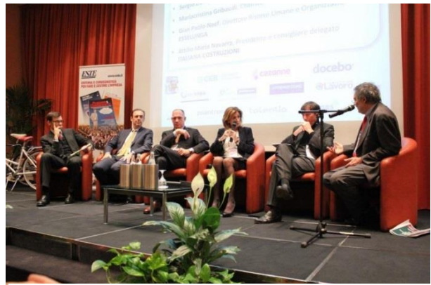
La tavola rotonda fra Imprenditori e Direttori Hr