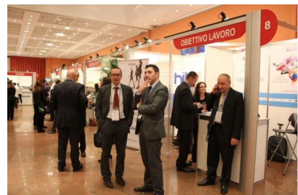
Occasioni di contatto fra sponsor e partecipanti