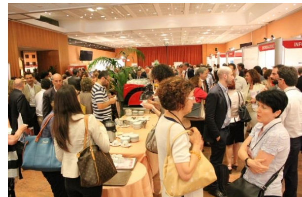
Networking nella zona espositiva