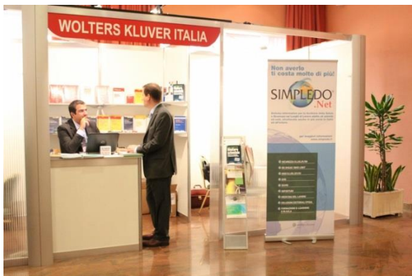
Visione frontale di uno stand