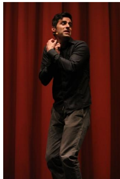
Uno scatto dallo spettacolo conclusivo "Dipendo da me"