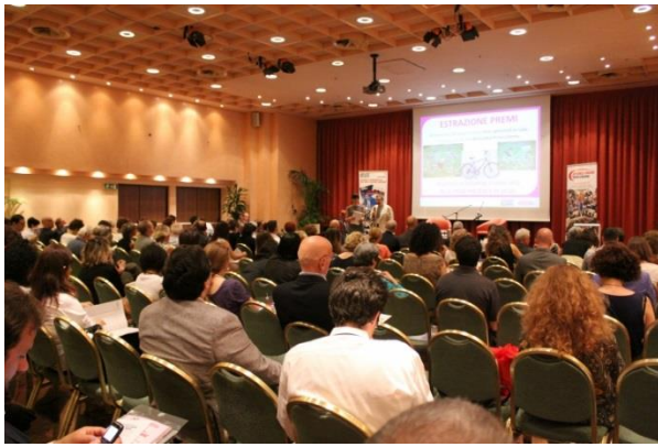
La platea del Convivio 2014