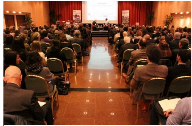
La sala dell'evento dal fondo