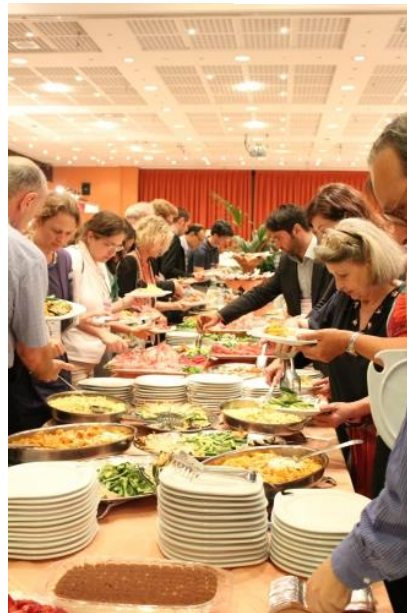
Partecipanti al buffet