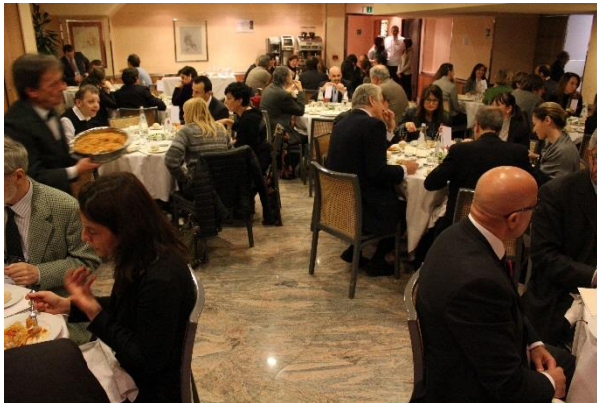
Networking durante la pausa pranzo